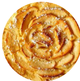
Pain aux pommes